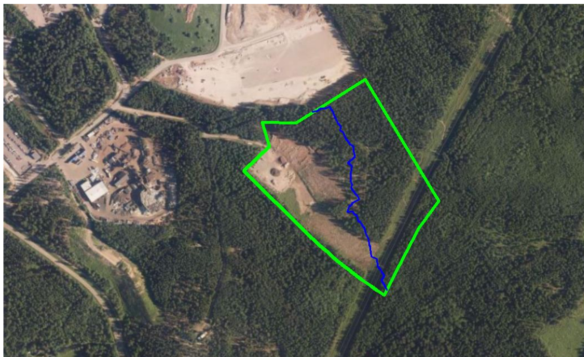
Kuva 1 Kiertotalouskeskuksen alueen raja (vihreä viiva) ja luontainen vedenjakaja (sininen viiva).

Suunnittelualue on nykyisellään pääosin luonnontilaista metsää. Nykytilanteessa suunnittelualueen läpi kulkee vedenjakaja, joka jakaa alueen luontaisesti kahteen eri valuma-alueeseen (kuva 1). Vedenjakajan itäpuolen vedet johtuvat maastoon ja länsipuolen vedet johtuvat pieniin uomiin ja lopulta n. 800 m päässä suunnittelualueesta sijaitsevaan Tuusulanjokeen, minne koko suunnittelualueen vedet tullaan alueen rakentamisen jälkeen johtamaan.