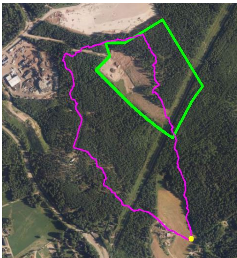
Kuva 3 Purkupiste (keltainen piste), purkupisteen luontainen valuma-alue (pinkki viiva) sekä suunnittelualueen rajausta (vihreä viiva).

Kuvassa 3 on esitetty Tuusulanjokeen laskevan pienemmän uomaston purkupiste, luontaisen valuma-alueen rajausta sekä Kiertotalouskeskuksen alueen rajausta. Luontaisen valuma-alueen pinta-ala on noin 22,4 ha ja Kiertotalouskeskuksen alueen noin 10 ha, josta puolet kuuluu nykytilanteessa luontaiseen valuma-alueeseen.