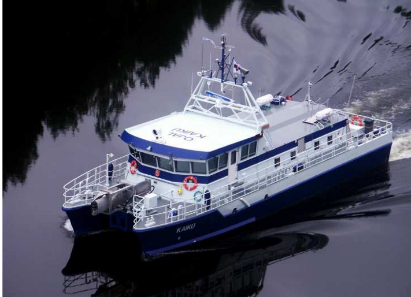
Kuva 2. Mea Kaiku