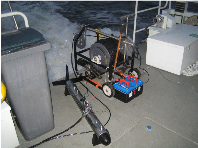
Kuva 3. Viistokaikuluotain Sonarbeam S-150